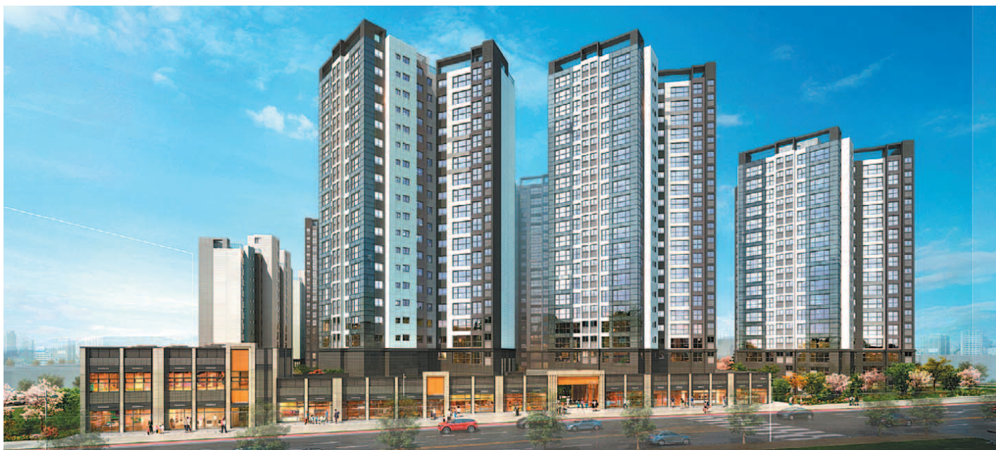
건설사들이 분양 리스크를 줄이기 위해 다양한 전용면적을 선보이고 있다. 자금 사정에 맞춰 선택할 수 있어 수요자들의 만족도도 높다. 사진은 동대문 '래미안 엘리니티' 투시도.

대부분 전용 59·84㎡ '평면 판박이' 전용 다양화한 아파트에 청약 몰려 동대문 '래미안 엘리니티' 등 주목