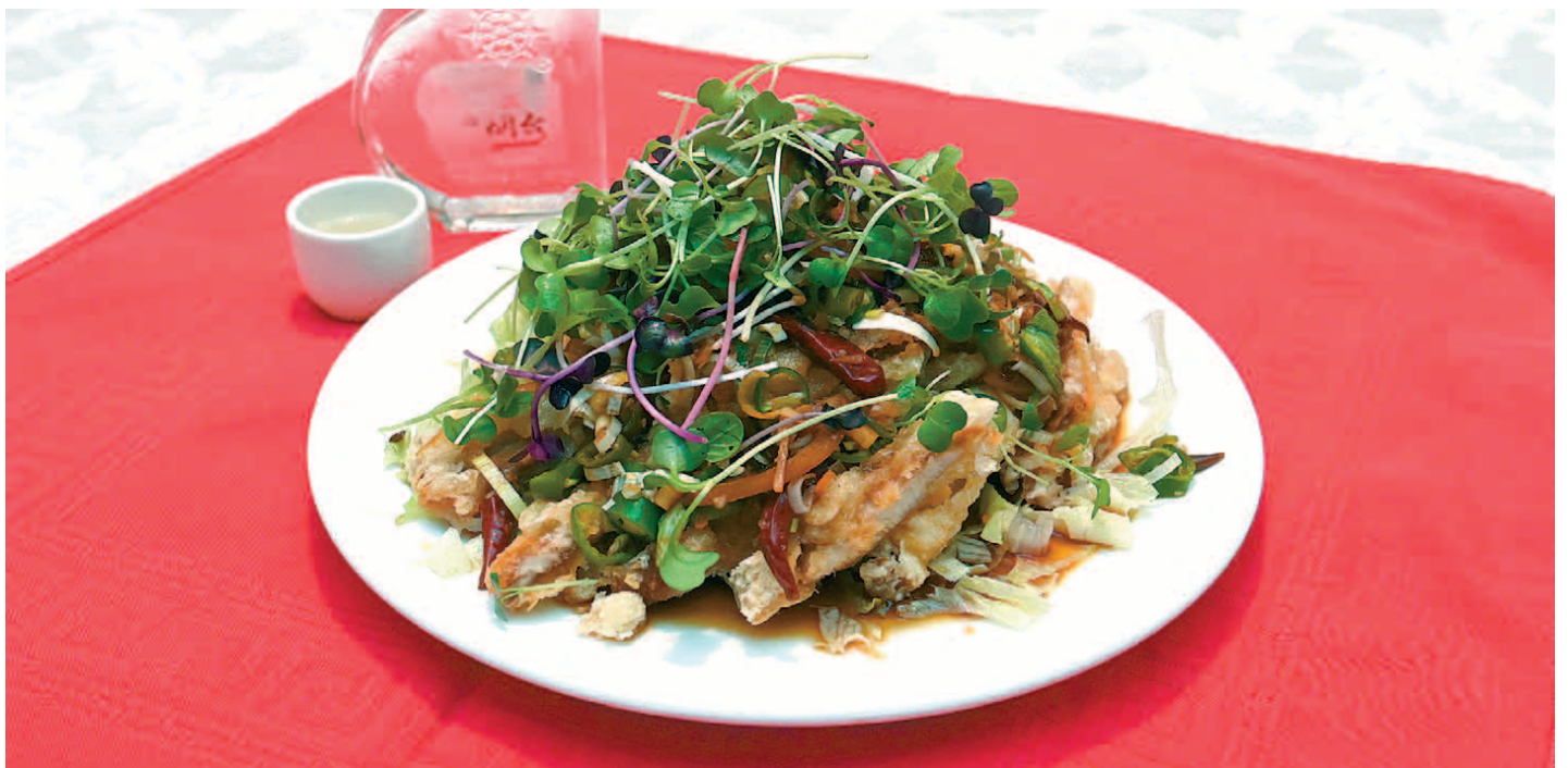
바삭하고 매콤한 유린기는 비 오는 날에 특히 생각 나는 요리다. 튀김옷을 입혀 튀긴 닭고기에 특제소스와 고추를 듬뿍 올린 유린기와 목구멍이 얼어 버릴 듯 시원한 맥주 한 잔이라면 긴 장마도 두려울 게 없다.

장마가 깊어지면서 비 불 날이 많아졌습니다. 어릴 적부터 비가 오는 날이면 늘 어머니께서 김치전, 호박부추전, 감자전 등을 만들어 주곤 하셨는데요.