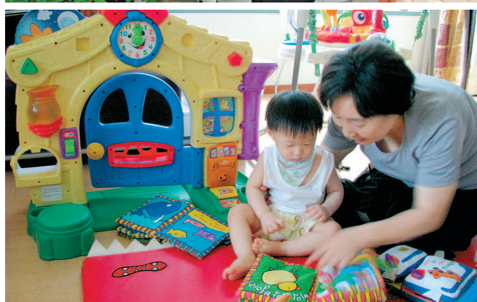
서울강남시니어클럽은 2002년부터 강남지역을 중심으로 다양한 노인 일자리 사업을 추진하고 있다. 풍선아트 교육강사 활동, 해피콜 지하철 택배, 시니어 아이케어센터의 활동 모습.

심의 다양한 노인일자리사업을 개발 및 추진해 왔으며 활기차고 보람된 노년생활을 영위할 수 있도록 노인들에게 사회 참여와 소득창출의 기회를 제공한 점을 인정받아 이 상을 수상했다.