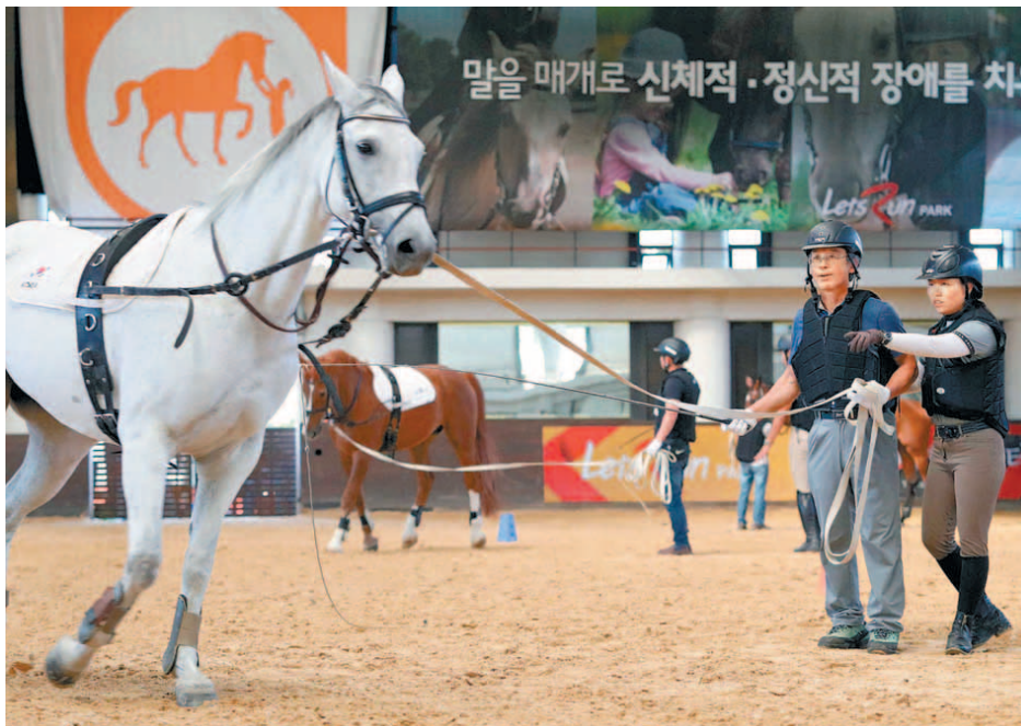
경주에서 은퇴한 퇴역마들은 대부분 승용마, 번식용, 교육용 등으로 전환되어 제2의 마생을 살게 된다. 승용마 전환을 위해 순지 훈련교육을 받고 있는 퇴역마.

승용마·교육용 등 진로 다양 일본경마회, 승용마 전환 지원 마사회, ‘말 이력시스템’ 구축