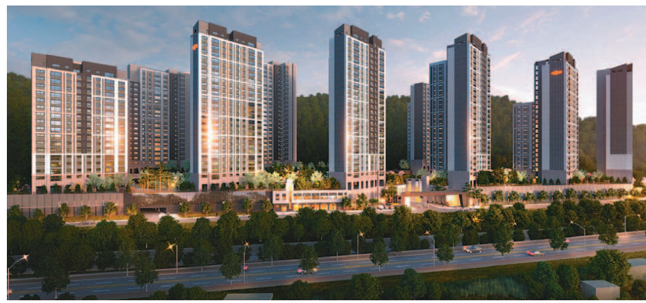
연내 1만1000여 가구의 물량이 공급되는 호남권의 아파트 분양열기가 뜨겁게 달아오르고 있다. 대림산업이 전남 순천에 10월 분양 예정인 'e편한세상 순천 어반타워' 투시도.

광주 7곳·전북 5곳·전남 4곳 브랜드 건설사 시공 많아 인기 주거환경 좋아 경쟁 치열할 듯