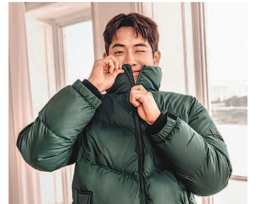
컬럼비아 '잡스 스위프TM II 다운자켓'