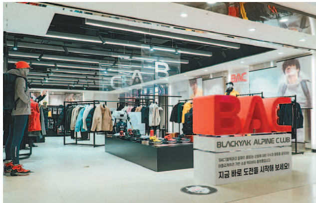
롯데백화점 본점 '블랙야크 알파인 클럽 팝업 스토어'