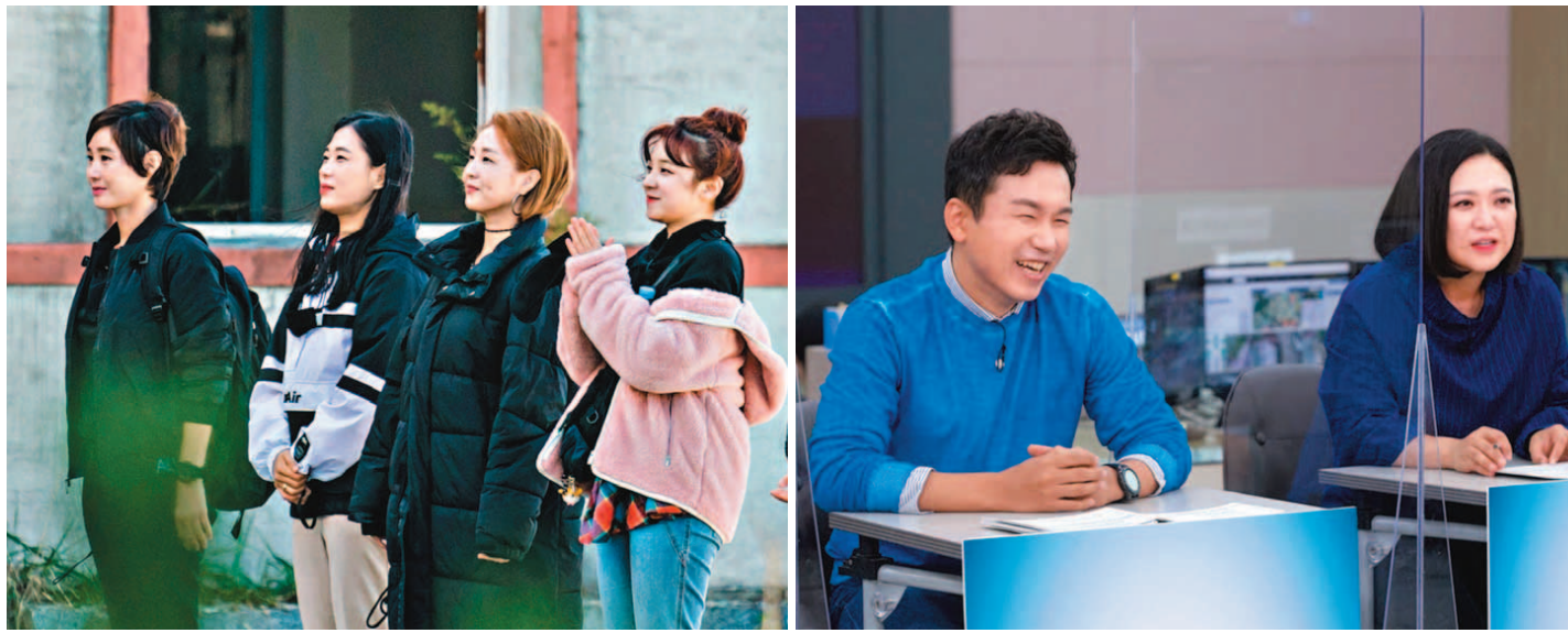
'생존'을 전면에 내세운 예능프로그램인 tvN '나는 살아있다'(왼쪽)와 KBS 2TV '재난탈출 생존왕'이 잇달아 시청자를 찾는다.

오늘 tvN '나는 살아있다' 첫 방송 화제·홍수 등 재난 생존기술 배워 KBS '재난탈출 생존왕' 20일 첫 선 재난 상황 탈출법 등 안전수칙 초점