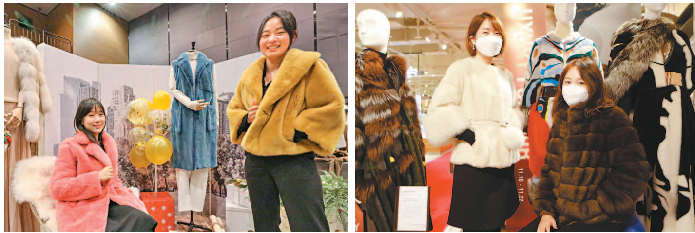
모피 성수기인 겨울 시즌을 맞아 백화점 업계의 모피 할인행사가 한창이다. 현대백화점 '2020년 모피대전' (왼쪽)과 롯데백화점 '모피 박람회'

내년 신상 모피 가격 크게 상승 예정 롯데백, 1000억 물량 모피 박람회 현대백도 10개 브랜드 할인전 진행