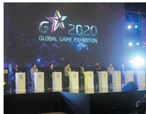
19일 부산 벡스코에서 열린 '지스타 2020' 개막식에서 참석 내빈들이 인사말을 하고 있다.

4일 동안 온라인 중심으로 행사 진행 지스타TV, 18일까지 150만명 시청