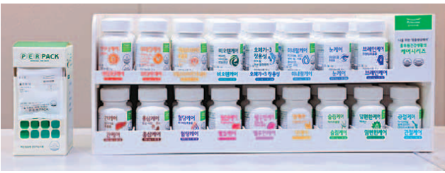
풀무원건강생활 '케어 시리즈'

2019년 10월 기아차에 합류한 카림 하비브 기아 디자인 센터장의 디자인 역량도 시험대에 오르게 됐다. 인피니티 수석 총괄 디자이너, BMW 총괄 디자이너, 벤츠 수석 섀시 디자이너를 거친 카림 하비브 전무가 기아차의 미래를 책임질 첫 번째 전기차의 브랜드 정체성을 어떻게 표현했는지 기대된다. 카림 하비브 기아 디자인 센터장은 "기아 브랜드를 실체적으로 느낄 수 있도록 보다 독창적이며 진보적인 전기를 디자인해 나갈 예정"이라고 밝혔다. 원성열 기자 sereno@donga.com