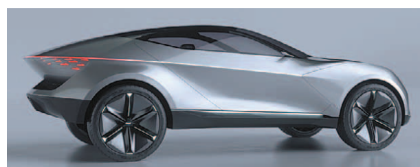
기아의 새 로고와 브랜드 슬로건 'Movement that inspires(영감을 주는 움직임)'. 미래 모빌리티 기업 기아의 첫 번째 전용 전기차인 'CV'의 디자인을 유추해볼 수 있는 크로스오버 EV 콘셉트카 '이매진 바이 기아'와 전기차 기반 SUV 쿠페 콘셉트카 '퓨처론'(위쪽부터).

현대차의 첫 번째 전기차 '아이오닉 5'의 티저 이미지는 공개되었지만 CV는 아직 크로스 오버 형태의 디자인이 적용됐다는 것 외에는 구체적인 이미지가 공개된 적이 없다.