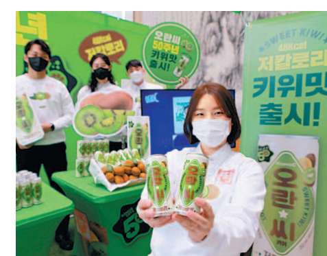
동아오츠카 '오란씨 키위'

해태제과는 장수 크래커 에이스의 신제품 '뉴욕치즈케이크' 맛을 선보였다. 에이스에 뉴욕치즈케이크의 주원료인 크림치즈를 더해 진한 치즈 맛이 특징이다. 아메리카노 커피와 최적의 맛 조합을 찾아냈다는 게 회사 측 소개다. 오리온의 장수 과자인 초코송이는 자매품 하양송이로 변신을 꾀했다. 송이버섯 줄기 모양인 과자 막대기