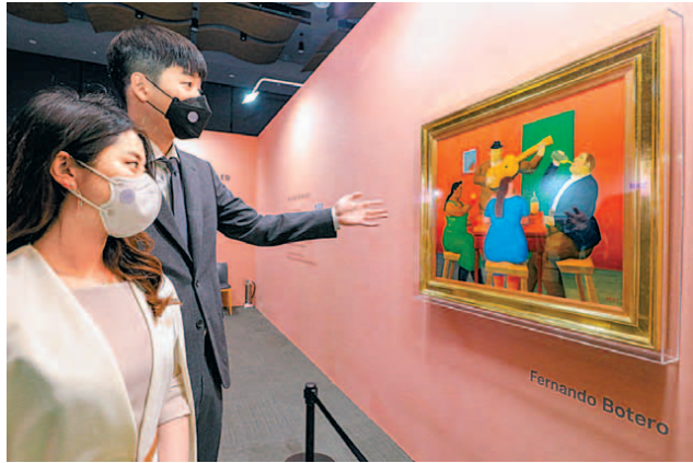
백화점에서 유명 작가들 작품 즐기기

현대백화점이 5월 2일까지 무역센터점 10층 문화홀에서 체험형 전시회 '더 아트 유 러브'를 진행한다. 페르난도 보테로의 '피플 드링킹', 키스 해링의 '무제' 등 해외 유명 작가의 작품을 전시한다. 또 르누아르와 모네의 작품을 활용한 영상 미디어 아트존도 선보인다.