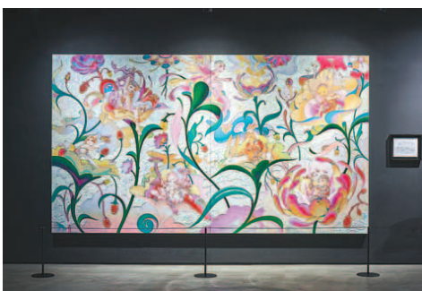
방탄소년단, 뉴이스트, 여자친구 등 하이브 소속 가수들의 음악을 주제로 마련된 전시 공간 '하이프 인사이드'. 지하 1~2층에서는 이들의 앨범, 그림, 트로피컬, 의상(왼쪽 위부터 시계 반대 방향으로) 등 다양한 형태의 콘텐츠가 펼쳐진다.