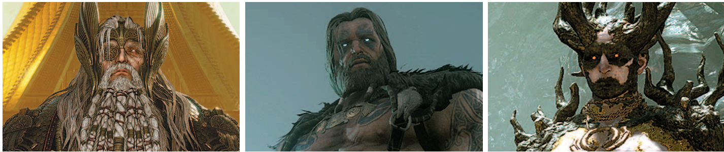
카카오킴즈가 29일 모바일 다중접속역할수행게임 '오딘: 발할라 라이징'을 출시한다. '오딘: 발할라 라이징' 대표 이미지와 게임 속 등장하는 로키, 토르, 오딘(위부터 시계방향)

올해 최고 기대작 중 하나인 '오딘: 발할라 라이징'이 29일 드디어 출격한다. 카카오킴즈가 서비스하는 모바일 다중접속역할수행게임(MMORPG)이다.