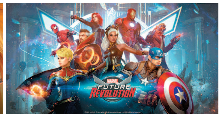
하반기 국내 게임 시장에 변화의 바람이 불고 있다. 양대 마켓 매출 1위에 오른 카카오게임즈의 ‘오딘: 발할라 라이징’, 넷마블과 마블의 두 번째 협업작 ‘마블 퓨처 레볼루션’, 엔씨소프트의 기대작 ‘블레이드&소울2’(위부터 시계방향).

에선 3위, 구글플레이에선 4위에 랭크돼 있다. 일본 등 해외에서도 인기를 끌고 있다.