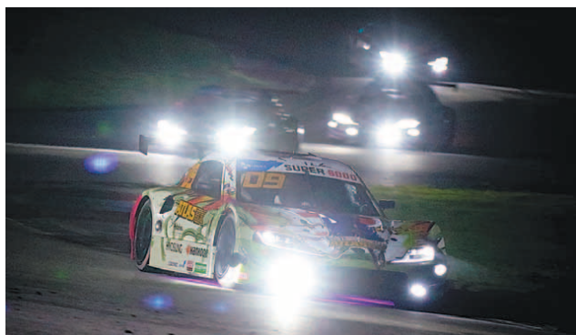
김종겸이 10일 인제 스피디움에서 열린 2021 CJ대한통운 슈퍼레이스 챔피언십 2라운드 나이트레이스에서 선두로 질주하고 있다.