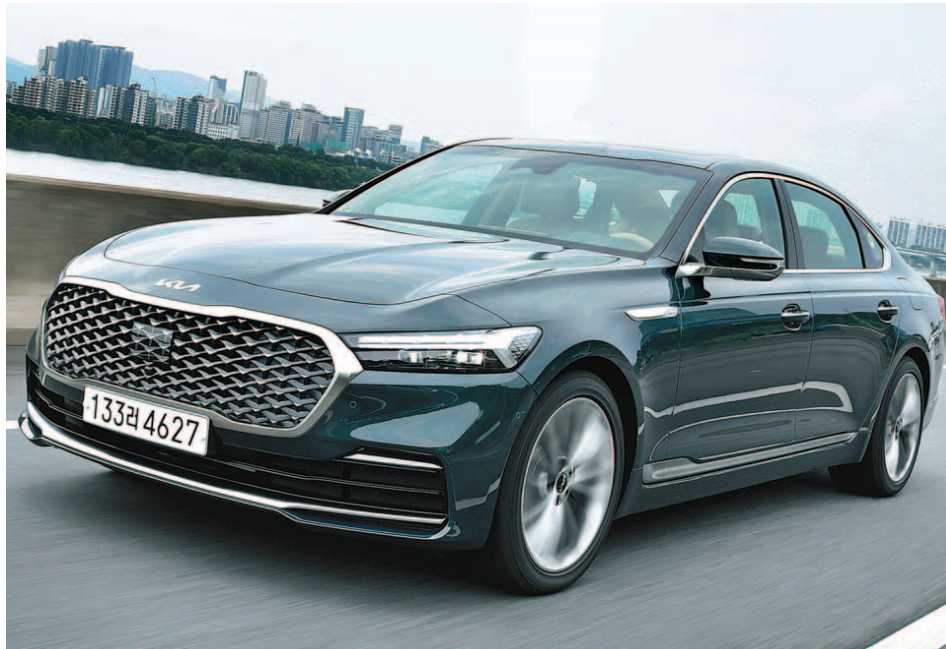
더 뉴 K9은 세계 최초 적용된 전방 예측 변속 시스템, 프리뷰 전자제어 서스펜션, 고속도로 주행 보조2 등 다양한 주행 신기술을 적용해 승차감과 주행 안전성을 대폭 강화했다.