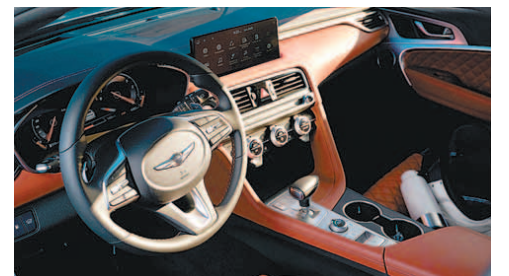
제네시스의 유럽 전략 차종 'G70 슈팅 브레이크'가 영국에서 세계 최초로 공개됐다. 유럽에서의 브랜드 인지도를 높일 핵심 차종이다.