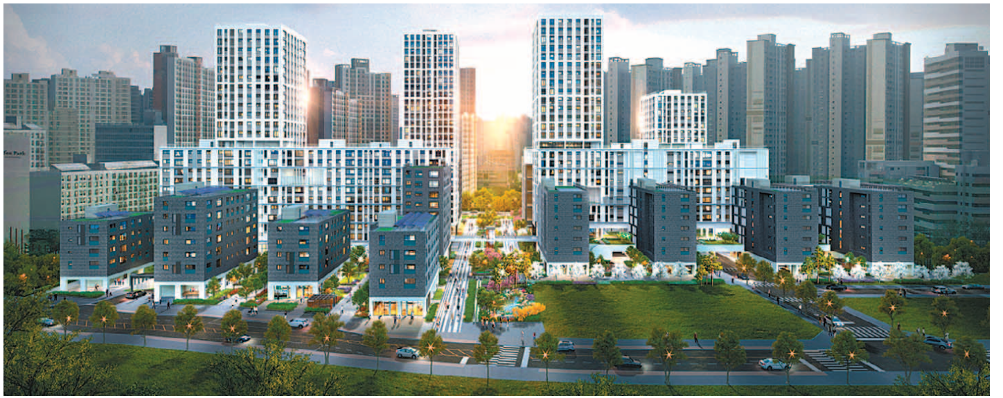
DL이앤씨가 분양에 나서는 'e편한세상 강일 어반브릿지'의 투시도. 근래 보기 드문 서울의 신규 분양 아파트로 큰 관심을 모으고 있다.

전용면적 84·101㎡ 총 593세대 3월에 개통된 5호선 강일역 인접 강술초·강명중·배재고 학군도 국 근방 고덕비즈밸리 조성도 호재