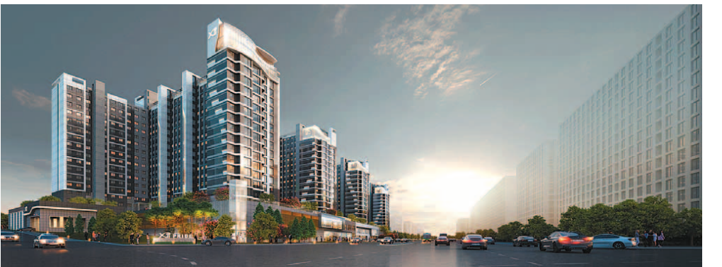
GS건설이 간판 브랜드 자이를 앞세워 리모델링 사업에 본격적으로 뛰어든다. 사진은 지난 4월 GS건설이 시공사로 선정된 문정건영아파트 리모델링사업 투시도.

GS건설 리모델링팀은 앞으로 사전 기술영업을 통한 리모델링 사업 발굴 및 수주와 수주 단지의 사업 관리를 담당하게 된다. 이를 통해 리모델링 기술 확보 및 사업