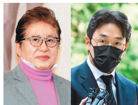
배우 김용건(왼쪽)과 그의 아들 하정우가 각각 강요미수 혐의 피소·프로포폴 불법 투약 혐의로 구설에 오르면서 연기 활동에 상당한 타격을 입게 됐다.

김용건의 아들 하정우(43·김성훈)도 곤욕스럽기는 마찬가지다. 그는 프로포폴 불법 투약 혐의(마약류 관리에 관한 법률 위반) 혐의로 10일 재판정에 섰다. 2019년