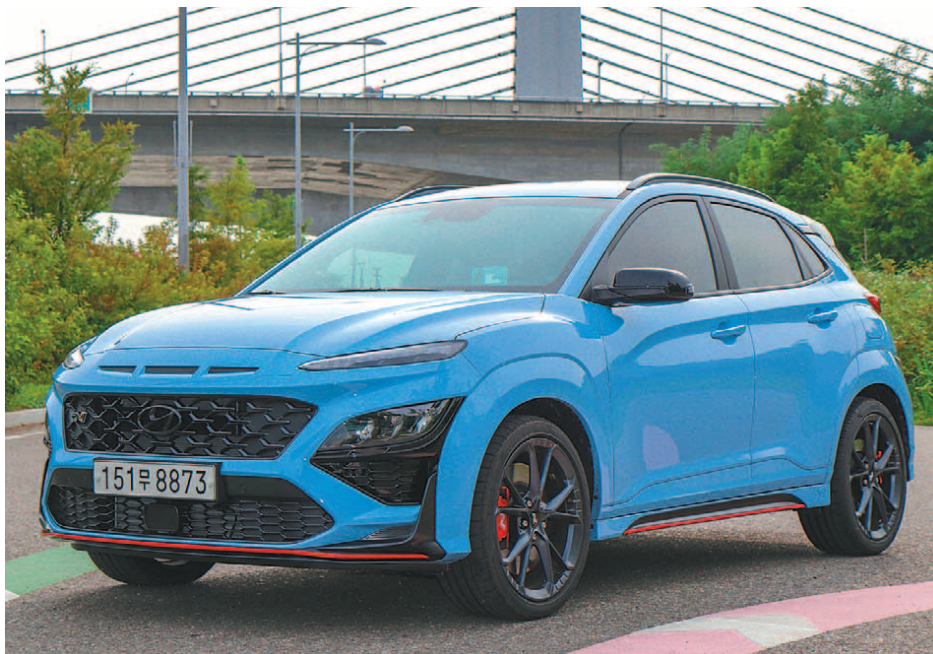
현대차의 첫 번째 고성능 SUV 모델인 코나 N은 최고출력 280마력, 제로백 5.5초의 고성능과 운전 실력을 프로드라이버 수준으로 올려주는 각종 N 특화 기능을 3418만 원부터 누려볼 수 있는 완성적인 모델이다.

제로백 5.5초... 폭발적인 가속력 NTS 장착 누구나 역동적 코너링 팝앤뱅사운드로 운전 쾌감 증가 현대차, WRC 우승 기술력 담아