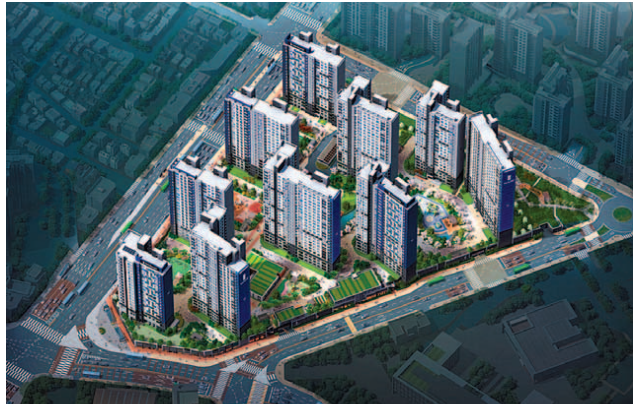
2024년 3월 경기 하남시에 들어설 '더샵 하남에디피스' 조감도.