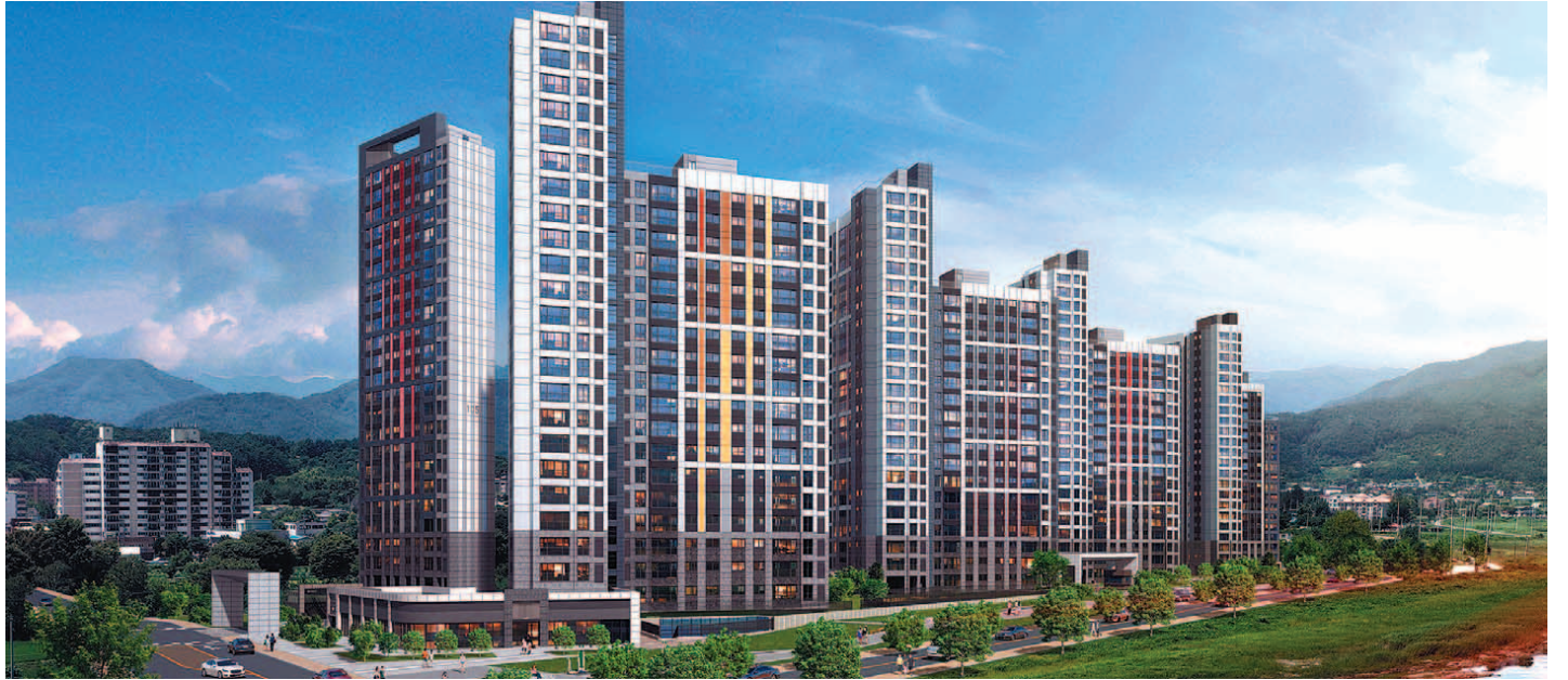
현대건설이 수도권 내 비규제지역인 경기 가평군에 선보이는 '힐스테이트 가평 더뉴클래스'. 높은 미래가치와 브랜드 파워, 우수한 특화 설계 등 장점이 많아 수요자들의 관심을 끌고 있다.

특히 가평에 들어서는 첫 번째 힐스테이트 브랜드인 만큼 상징성도 높다. 힐스테이트 브랜드는 부동산 리서치회사 닥터아파트가 지난해 11월 발표한 '2020 아파트 브랜드 파워 설문조사'에서 1위를 차지해 2년 연속 1위를 기록했다. 인지도,