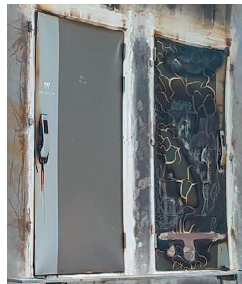
DL이앤씨가 개발한 공동주택 방화문. 방화 실험에서 기존의 방화문보다 더 뛰어난 성능이 확인됐다.

외기에서 발생하는 소음과 열을 차단할 수 있는 '고단열 고차음 실외기실 개폐문'도 개발을 완료했다. 겨울에도 단열 성능 개선을 통해 에너지 손실과 결로 등의 문제