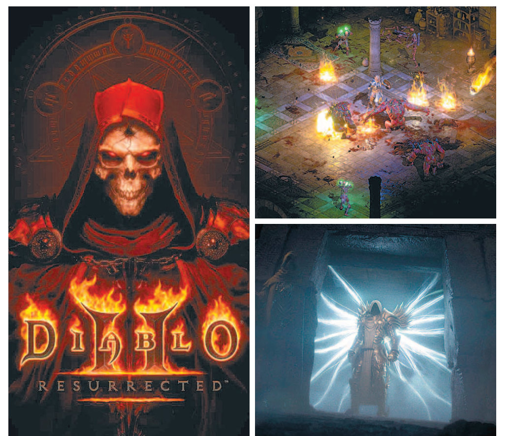
2000년 출시돼 선풍적 인기를 모은 '디아블로2' 및 확장팩을 리마스터한 '디아블로2: 레저렉션'의 대표 이미지와 플레이 화면, 시네마틱 영상(왼쪽부터 시계방향).