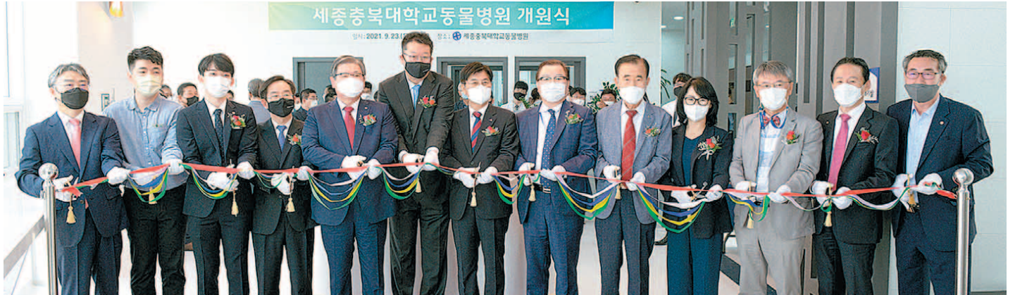
충북대가 23일 수의과대학 부속동물병원의 본원인 세종충북대 동물병원을 개원했다. 세종시 대평동에 위치한 동물병원은 490㎡ 규모에 진료실, CT실, 수술실 등 첨단 시설을 갖췄다. 개원 축하 기념 테이프를 자르고 있는 참석자들.

세종시 대평동 490㎡ 규모 개원 10월 1일부터 본격 진료 서비스 "반려동물 진료 수요 충족 기대감"