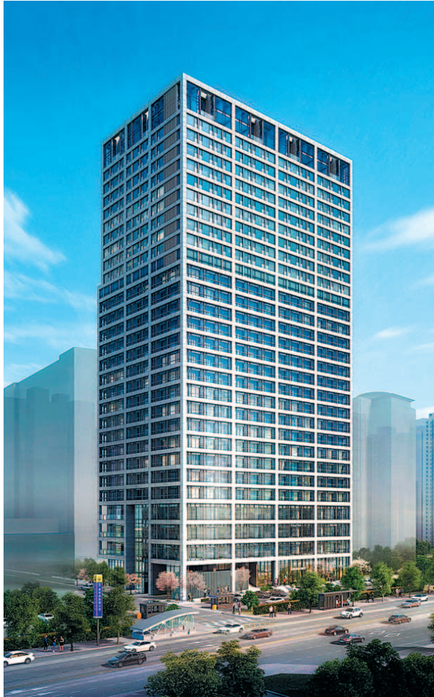
현대건설이 10월 분양 예정인 힐스테이트 과천청사역의 투시도. 주거형 오피스텔, 섹션오피스, 근린생활시설이 결합된 주거복합단지 조성이 예상된다. 투자 가치가 높아 예비 수요자들의 관심이 뜨겁다.

과천에 줄지어 예정된 굵직한 개발호재를 모두 누리는 수혜단지로서 높은 미래가치도 기대할 수 있다. 정부 과천청사역에는 향후 GTX-C 노선과 위례-과천선이 개통될 예정이라 교통편의성이 더욱 확대될 것으로 예상된다. GTX-C 노선 이용시에는 삼성역까지 약 7분 정도면 이동이 가능해 강남접근성이 크게 향상될 것으로 기대된다. 인근에는 과천~이수간 복합 터널(예정)이 2026년 완공을 목표로 추진되고 있어 광역교통망도 더욱 편리해질 전망이다.