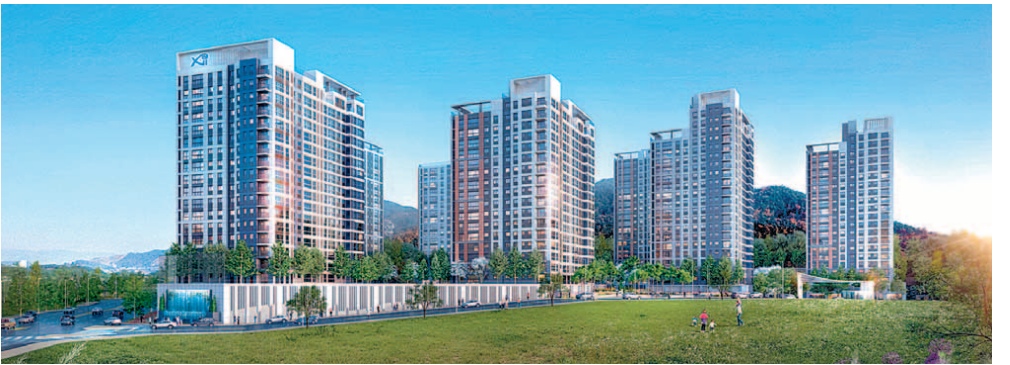
GS건설이 짓는 동해자이 투시도. 사동팔달 교통망의 중심에 있고, 동해 최초로 커뮤니티 내 사우나 시설까지 갖춰 눈길을 끌고 있다. 19일 1순위 청약이 진행된다.

'자이(Xi)' 브랜드 파워에 걸맞은 단지 설계와 상품성도 돋보인다. 동해안의 절리, 해안과 파도의 역동적인 풍경을 모티브로 한 리조트 감성의 '이스트코스트신(East Cost Scene)' 디자인 콘셉트를 단지 외관과 문주, 공용부 부분 등에 적용할 계획이다.