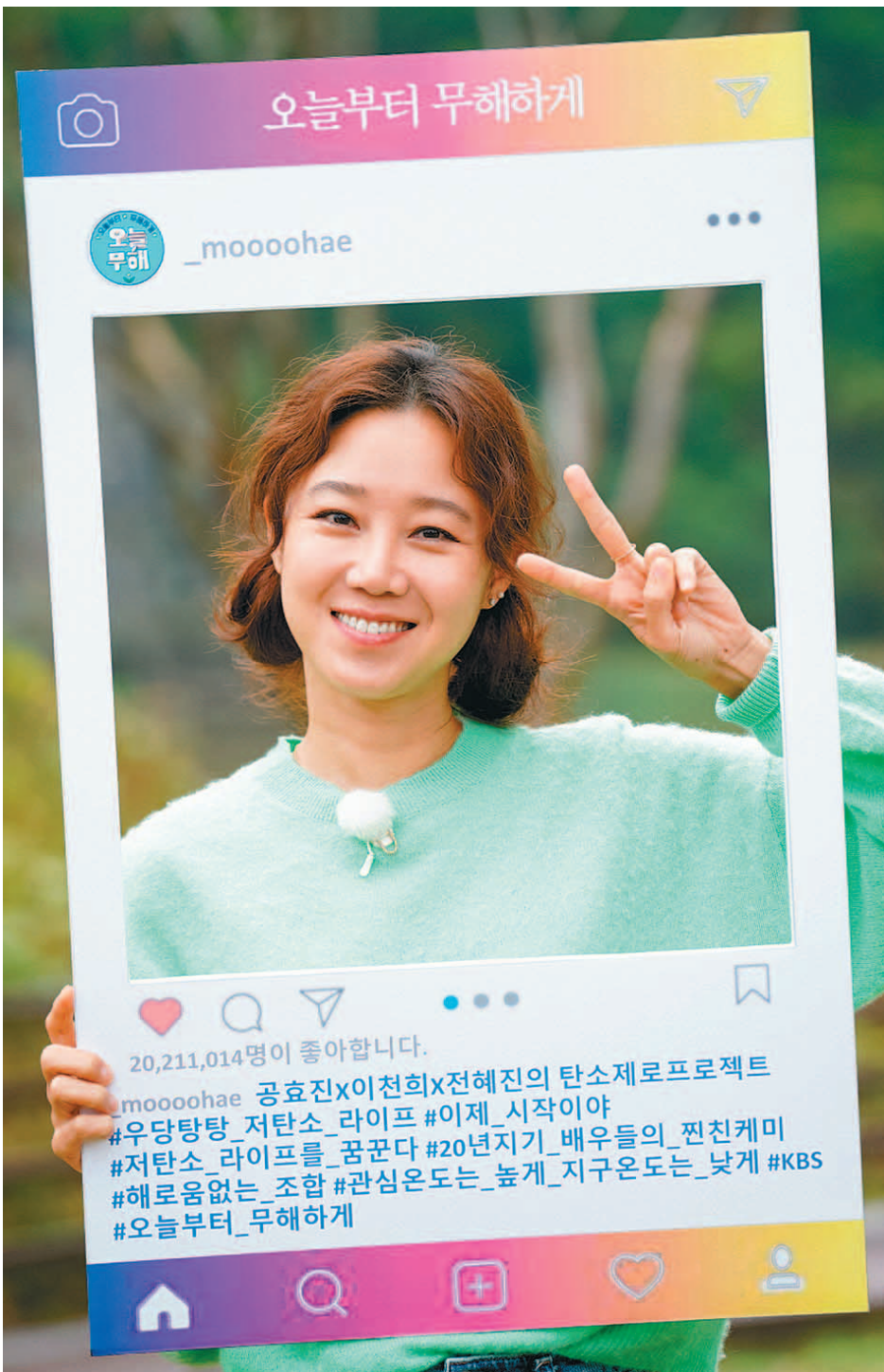
배우 공효진이 14일 열린 KBS 2TV 예능프로그램 '오늘부터 무해하게' 온라인 제작발표회에서 환하게 미소 짓고 있다.

'오늘부터 무해하게'는 공효진이 이천희·전혜진과 함께 충남 보령 죽도에서 일주일 동안 '탄소 제로'에 도전하는 과정을 담는다. 기후변화에 악영향을 미치는 탄소를 배출하지 않기 위해 자가발전 동력기의 폐달을 끊임없이 밟고, 구황작물을 키운다. 성공하면 1만 그루의 나무를 기부하게 되지만, 탄소를 배출하면 양에 따라 그루수를 차감한다. 모두 공효진의 아이디어에서 비롯됐다.