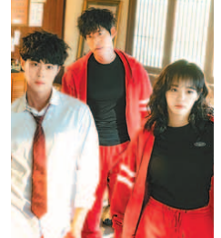
OCN '경이로운 소문'

OCN 드라마 '경이로운 소문', E 채널 예능프로그램 '노는언니' 등이 '2021 케이블TV 방송대상' 시상식에서 대상을 받았다. 한국케이블TV방송협회가 주최하는 이 행사는 종합유선방송사업자(SO)와 방송채널사용사업자(PB)를 아우르는 유료방송 시상식이다. 이날 온라인으로 진행된 행사에서 유준상과 조병규가 주연한 '경이로운 소문'과 박세리 등 스포츠스타들이 총출동하는 '노는언니'가 각각 드라마와 예능 부문 대상을 받았다. 개그우먼 김민경이 출연한 IFQ '시켜서 한다! 오늘부터 운동!'이 뉴미디어상, tvN '사랑의 불시착'이 VOD상을 각각 수상했다.