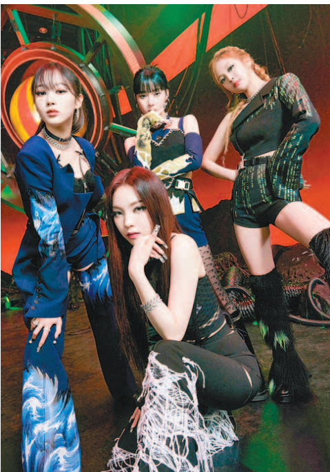
걸그룹 에스파가 최근 발표한 첫 번째 미니음반 '새비지'로 '3연속 히트'에 성공했다.

최근 발표한 '새비지'로 3연속 히트 각종 음원차트 일간·주간 1위 차지 독특한 '아바타 세계관' 인기 한 몫 내일 美 NBC 켈리 클락슨 쇼 출연