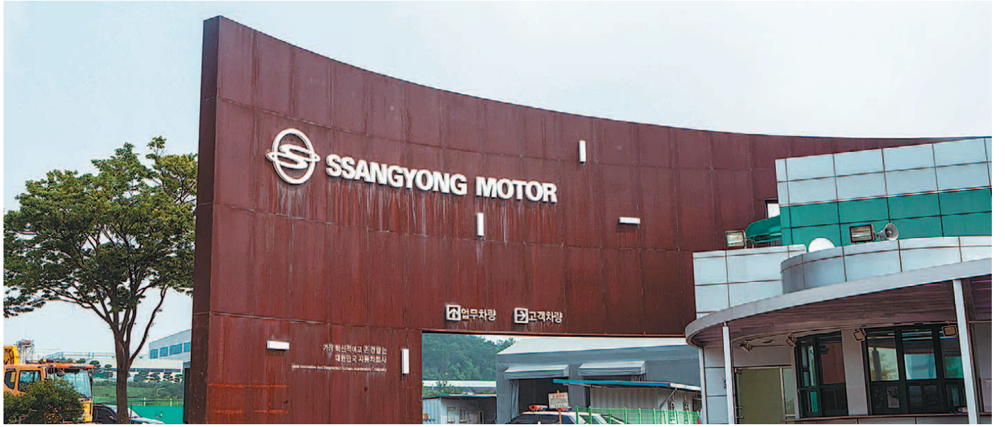
쌍용자동차의 새주인 후보가 전기버스 생산업체인 에디슨모터스로 결정됐다. 2010년 인도 마힌드라와의 인수·합병 이후 11년 만에 새 주인을 맞게 된 쌍용자동차 평택공장 정문.

에디슨모터스는 11월 초 약 2주간 쌍용차에 대한 정밀실사를 진행하고 인수 대금과 주요 계약조건에 대한