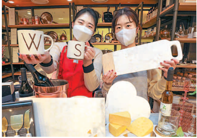
현대리마트, 홀파티 용품 최대 20% 할인 현대리마트가 운영하는 미국 프리미엄 주방용품 브랜드 '윌리엄스 소노마'가 30일까지 연말 홀파티를 겨냥한 홀파티 용품 할인 행사를 진행한다. 치즈보드, 와인칠러, 치즈 나이프 세트 등 홀파티 용품 100여 종을 최대 20% 할인 판매한다.