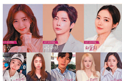
LG생활건강 '내추럴 뷰티크리에이터' 4기 모집 포스터.

자를 모집한다. 특히 취업준비생, 경력보유여성, 다문화가정, 결혼이주여성 등을 선발해 글로벌 콘텐츠를 제작할 예정이다. 4기 참가자는 내년 1~3월 뷰티, 환경, 촬영, 영상 편집 등 각 분야 전문가가 진행하는 정규 교육을 받은 뒤 3개월간 실전 교육 및 미션 활동을 수행한다. 활동이 우수한 참가자는 '라이브커머스 진행자(호스트)' 과정에 참여할 수 있는 기회를 준다. 교육 과정은 전액 무료이며, LG생활건강 브랜드 제품과 활동비도 제공한다. 회사 측은 "우리 사회의 보이지 않는 벽에 부딪힌 여성들의 터닝 포인트가 될 수