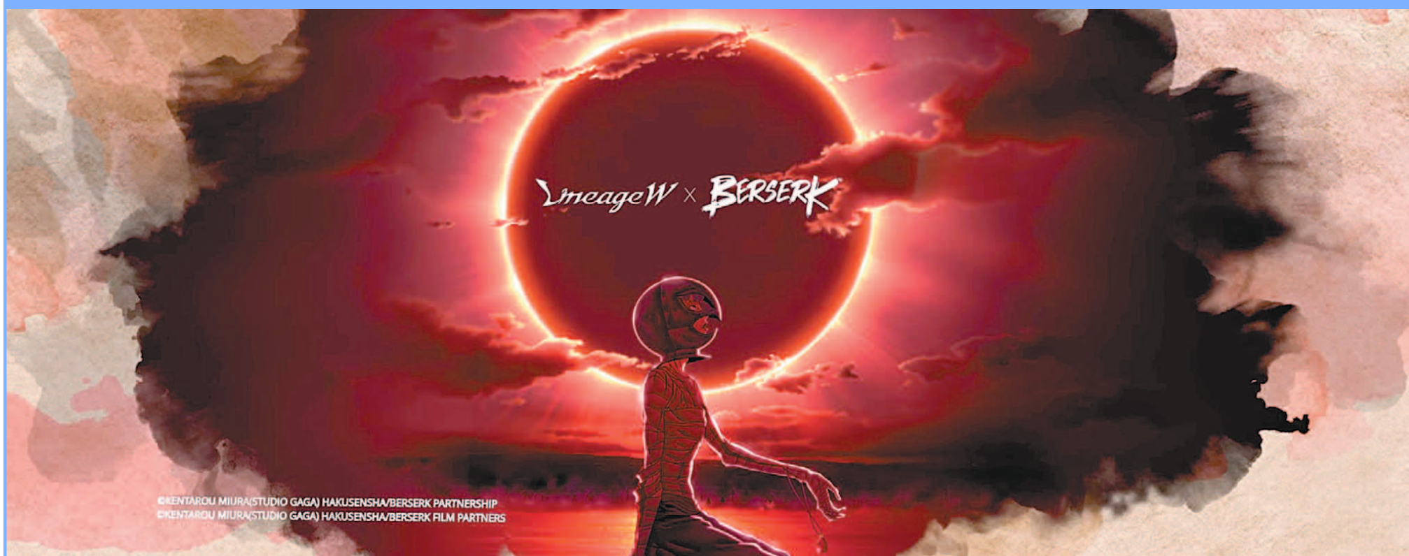
엔씨소프트의 '리니지W'가 슈퍼 지적재산권(IP)과의 협업 등 글로벌 요소를 강화해 아시아를 넘어 북미와 유럽 시장 문을 두드린다. '베르세르크'와 협업 이미지.