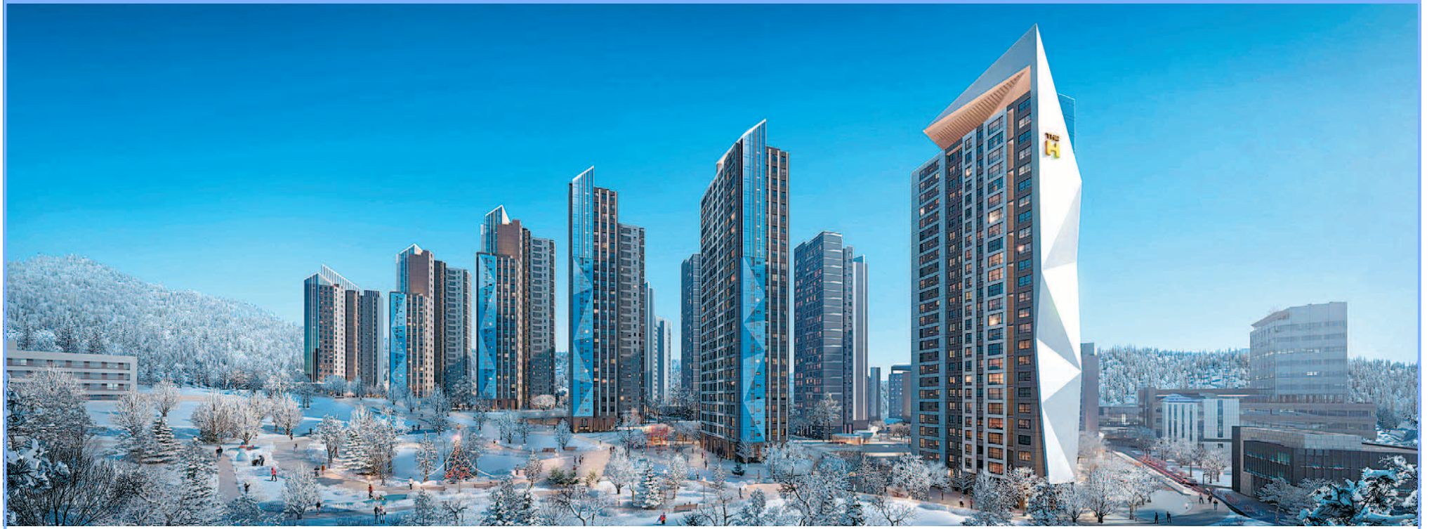
현대건설이 올해 도시정비사업부문 누적 수주액 5조 원을 넘어서며 창사 이래 최대 실적을 달성했다. 현대건설이 최근 사업자로 선정된 흑석9구역 재개발사업 조감도.