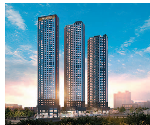
달서 롯데캐슬 센트럴스카이 투시도.

달서 롯데캐슬 센트럴스카이는 빼어난 교통여건과 교육여건을 두루 갖추고 있다. 단지 주변에 위치한 구마로를 이용하면 성서산업단지도 쉽게 진입할 수 있다. 남대구 IC를 이용하면 중부내륙고속도로 지선으로 수월하게 진입할 수 있다. 감천초교와 감천초 병설유치원이 근거리에서 있어 어린 자녀들의 안전한 통학이 가능하다. 효성중과 효성여고, 대건고, 대구예담학교, 대구공