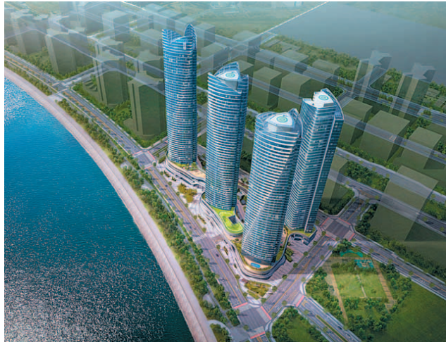
더샵 송도아크베이 조감도.