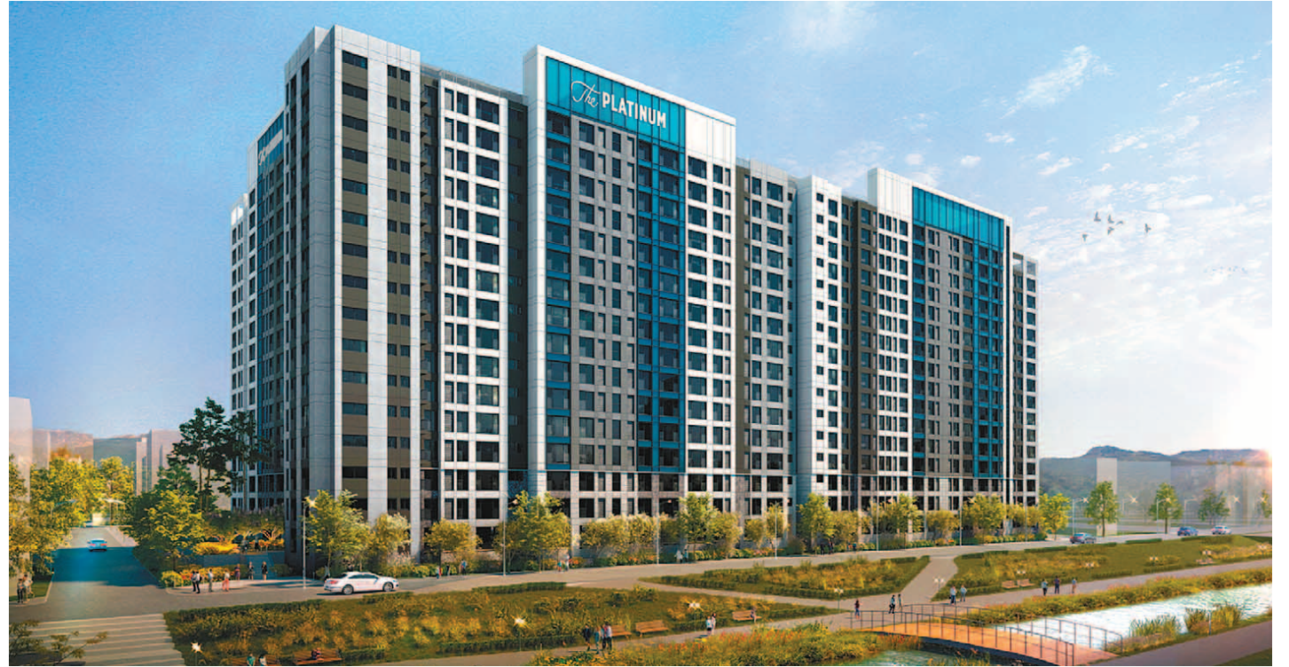
수평증축 리모델링을 통해 새롭게 태어나는 '송파 더 플래티넘' 조감도. 리모델링을 통해 추가된 29세대가 일반 분양을 통해 첫 주인을 기다린다. 국내 최초 리모델링을 통한 일반 분양이란 점에서 큰 의미를 지닌다.

수평증축 통해 전체 세대수 증가 총 328가구 중 29세대 일반분양 쌍용건설 특허 공법·신기술 눈길 올림픽공원 인접 자연환경 쾌적