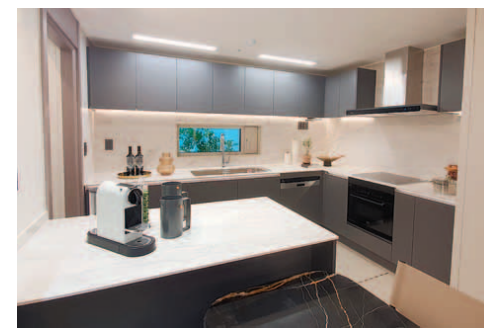
현대건설이 새해를 맞아 대표 브랜드인 힐스테이트 인테리어를 리뉴얼했다. 한층 더 세련된 힐스테이트 주방.

라이프스타일 변화로 소비자의 다양한 니즈를 만족시킬 수 있도록 평면이나 마감재들 외에 '옵션 다양화'를 추진하고, 같은