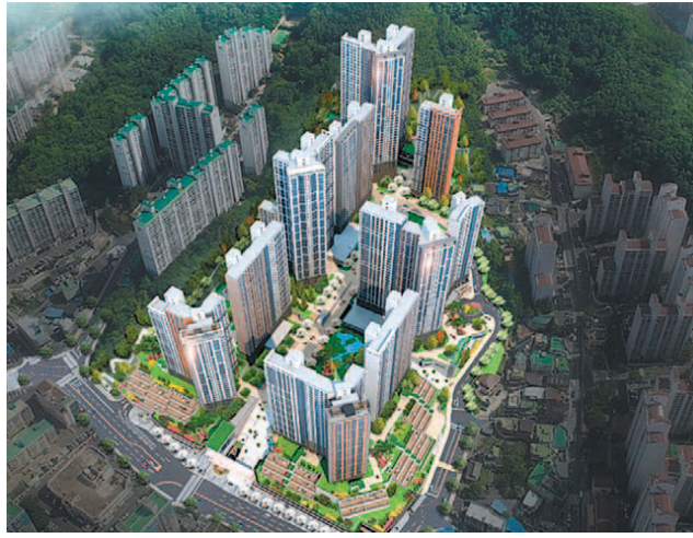
포항 북구에 들어설 '포항자이 애서턴' 조감도.