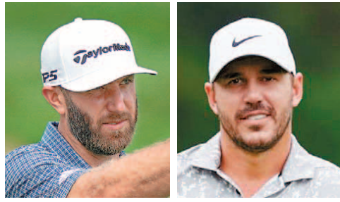
더스틴 존슨 브룩스 켈카

N 기존의 골프 다큐멘터리와는 다르다. 막대한 제작비, 초호화 캐스팅. 세계 최대 OTT(온라인 동영상 서비스) 넷플릭스가 "최고의 프로 골퍼들의 삶과 이야기를 담은 몰입형 다큐멘터리 시리즈를 제작하겠다"고 밝히면서 전 세계 골프 팬들의 관심을 끌고 있다. 넷플릭스는 더스틴 존슨, 브룩스 켈카, 저스틴 토머스, 콜링 모리카와 등 미국프로골프(PGA) 투어를 대표하는 스타들이 출연하는 골프 다큐멘터리 제작한다. 지난해 2월 차량 전복 사고로 다리를 다쳐 회복 중인 '골프 황제' 타이거 우즈는 출연하지 않는다. 넷플릭스 "마스터스를 비롯해 더 플레이스 챔피언십, 페덱스컵, PGA 챔피언십, US 오픈 챔피언십, 더 오픈 등에 출전한 선수들을 촬영하고 그 과정에서 이뤄지는 훈련과 원정 여행, 승리와 패배의 순간을 담은 예정"이라고 설명했다. PGA투어 선수뿐만 아니라 캐디와 코치,