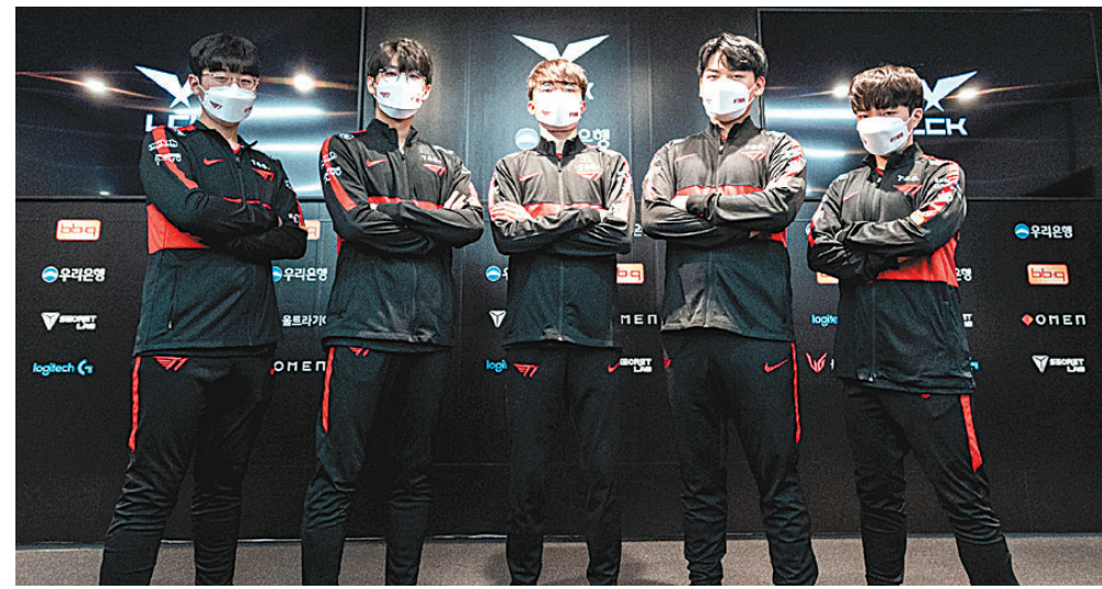
5년 만에 개막 4연승을 달리며 2022 LCK 스프링 단독 1위에 올라선 T1 선수들.

2주차에 관심을 모은 또 하나의 팀은 농심 레드포스다. 팀 개막전에서 한화생명e스포츠에 일격을 당했지만 리브 샌드박스를 꺾었고, 2주차에는 담원 기아와 KT 롤스터를 맞아 모두 2 대 1로 승리하면서 3연승을 이어갔다.