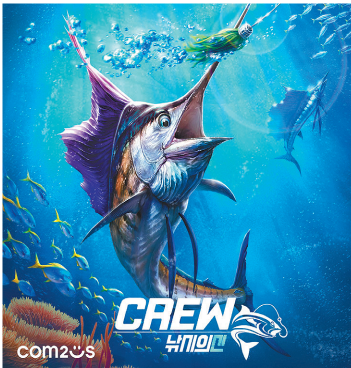
게임사들이 블록체인 기술을 활용한 서비스 준비에 속도를 더하고 있다. 컴퓨터가 블록체인 게임 플랫폼 ‘C2X’에 탑재해 출시할 예정인 ‘남시의 신: 크루’, 위메이드가 최근 전략적 투자를 단행한 멧쟁이사자처럼의 P2E NFT 카드게임 ‘실타레’.

위메이드 ‘위믹스’ 론칭해 가속도 컴퓨터 ‘C2X’ 구축 라인업 확대 엔씨·넷마블 등도 블록체인 준비 당국 규제 등 풀어야 할 과제 산적