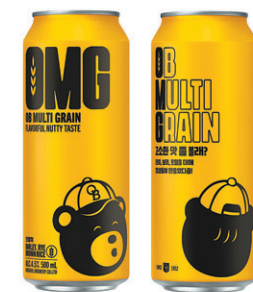
오비맥주의 프리미엄 발포주 'OMG'.

엄선된 현미, 보리, 호밀을 사용해 고소한 풍미를 구현한 프리미엄 발포주다. 캔을 따는 순간 느껴지는 풍부한 너트향과 부드러운 청량감이 특징이다. 소비자가 제품 음용 후 '놀라울 만큼(Oh My God)' 고소한 맛을 즐길 수 있다는 기획의도도 제품명에 간접적으로 반영했다. 제품 패키지에는 곡물을 상징하는 노란