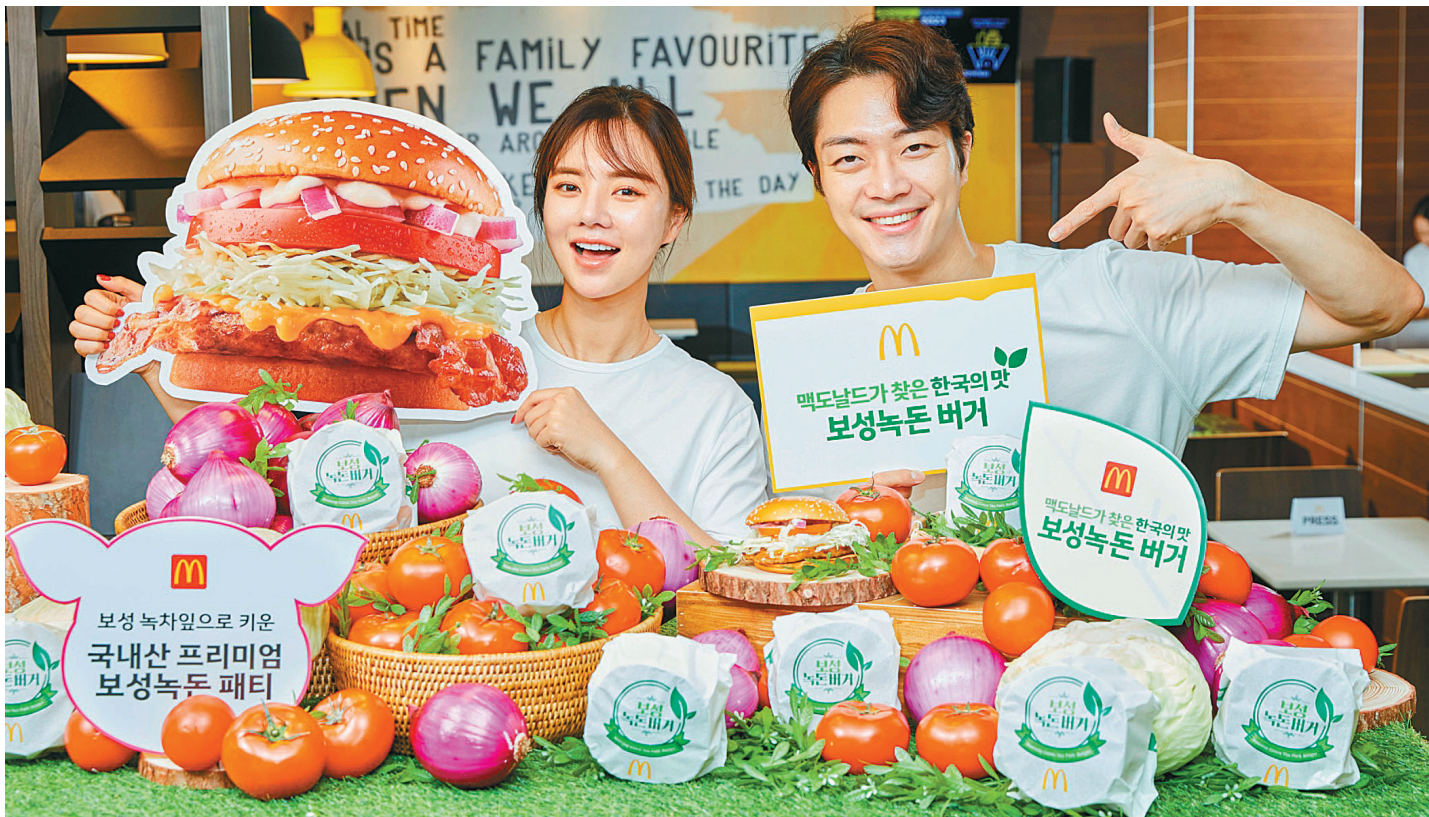
맥도날드가 여름 시즌을 맞아 메뉴 라인업 강화에 나섰다. '한국의 맛 프로젝트' 2단으로 선보인 '보성녹돈 버거'를 소개하는 모델들.

보성녹돈 버거는 전남 보성 녹차 잎 사료로 충청 지역 농장에서 키운 보성녹돈 패티를 넣었다. 보성녹돈은 육질이 연하고 부드러우며 잡내를 최소화한 국내산