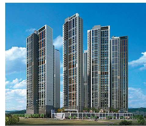
힐스테이트 대명 센트럴 2차 투시도.

단지는 우수한 교통여건을 자랑한다. 대구도시철도 1호선 영대병원역을 도보로 이용 가능하며, 현충로역도 인근에 위치해 역세권 입지를 갖추고 있다. 또한 대명로와 바로 인접해 있어 신천대로, 앞산순환