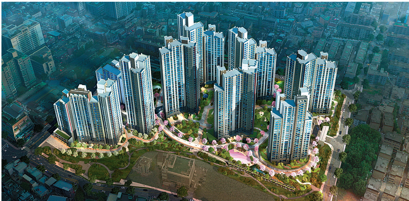
다양한 광역교통망을 갖춘 원당뉴타운의 첫 번째 대단지 아파트로 주목을 끌고 있는 '원당역 롯데캐슬 스카이엘'의 조감도.

3호선 역세권, 퀴드러플 교통 예약 여러 쇼핑몰 인접 생활인프라 풍부 '여행의 설렘' 안겨주는 조경 탁월 개방감 극대화...열린 조망권 확보