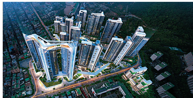
GS건설이 제안한 부산 부곡2구역 조감도.