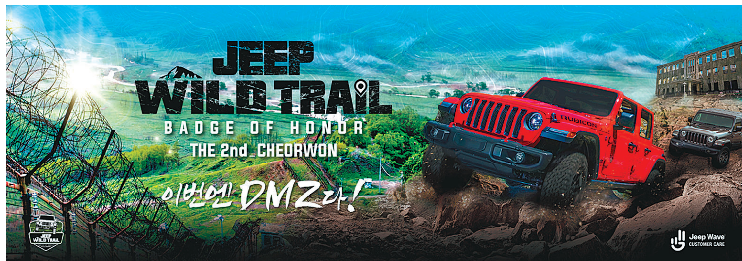
지프가 국내 최초 지프 전용 오프로드 트레일 프로그램 '지프 와일드 트레일 시즌2'를 강원도 철원 DMZ에서 진행한다.