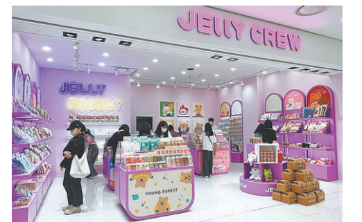
젤리크루 타임스퀘어점 전경.